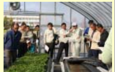
(いちご新育苗技術研修会)