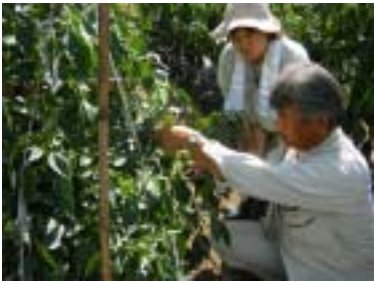
(普及指導員に対する現地指導)

普及センターが新技術の導入指導や高度な経営指導が、迅速かつ効果的にできるよう、最新の農業技術や施策推進に関する研修や情報提供を行っています。