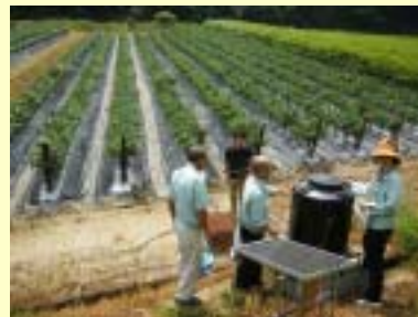
(拍動灌水現地実証)

収集した課題を整理・分析し、試験研究が効果的に実施できるよう提案しています。 また、試験研究で開発された技術が迅速に現場に普及・移転できるようにしています。