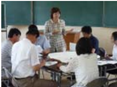
(ワークショップによる研修)