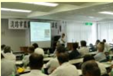
(集落営農組織育成指導)

農林水産ビジョンの達成に向けて普及センターを支援・指導しています。 また、施策立案の支援を行うとともに、県政課題の解決に向けた推進を図っています。