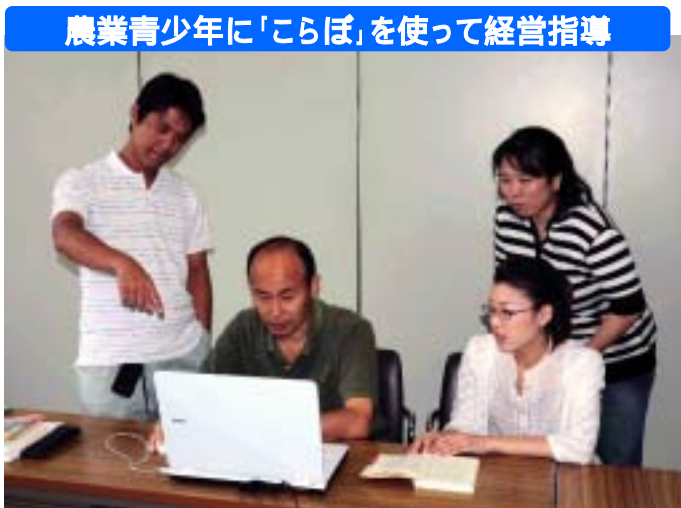
農業青少年に「こらぼ」を使って経営指導